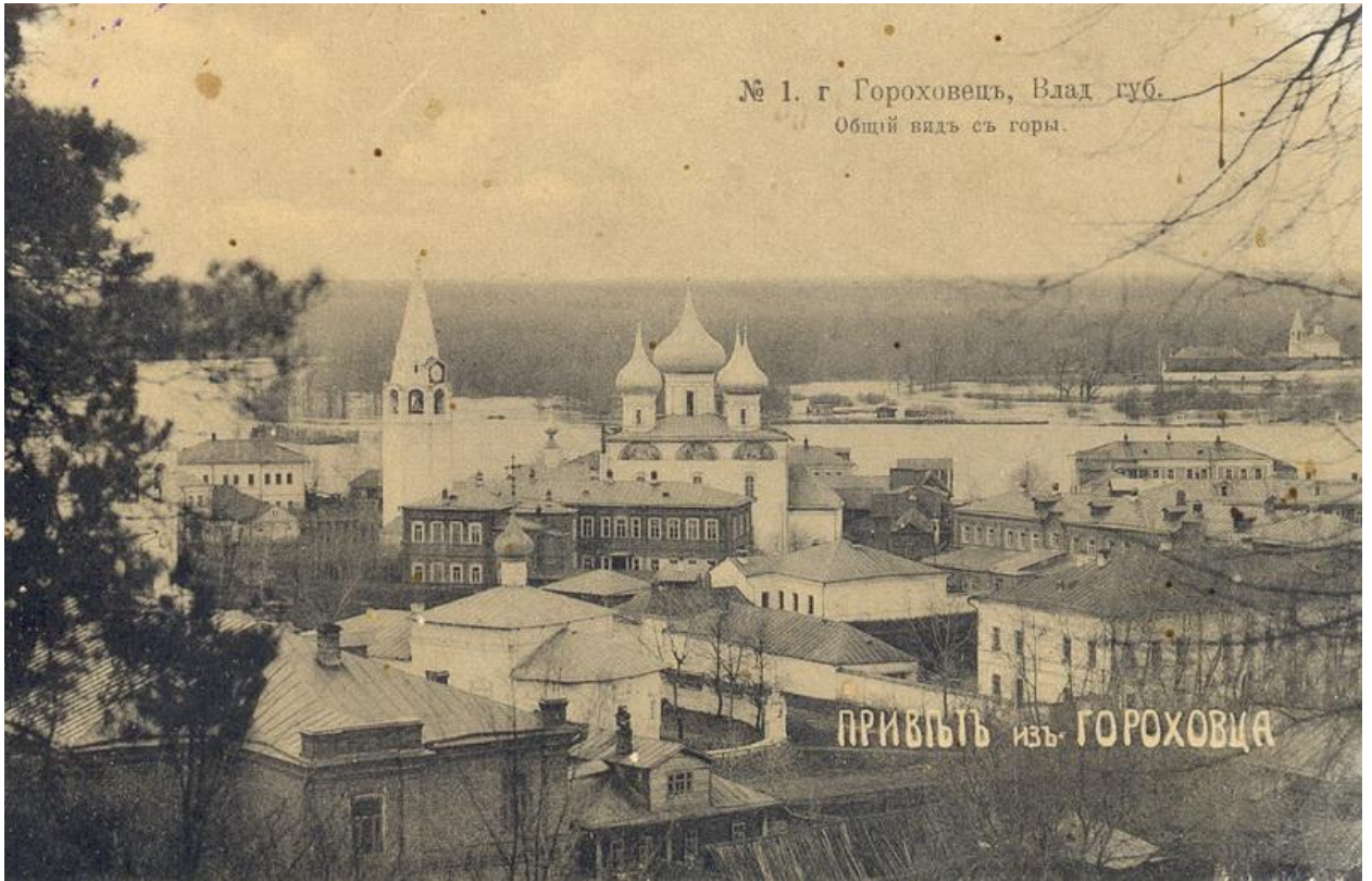
Фотография – Пужалова Гора