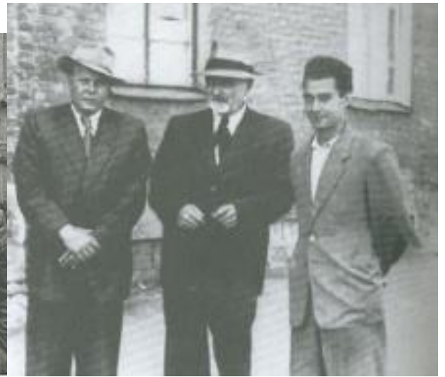
А. Дементьев с А. Твардовским и И. Соколовым-Микитовым Тверь, 1957 г.