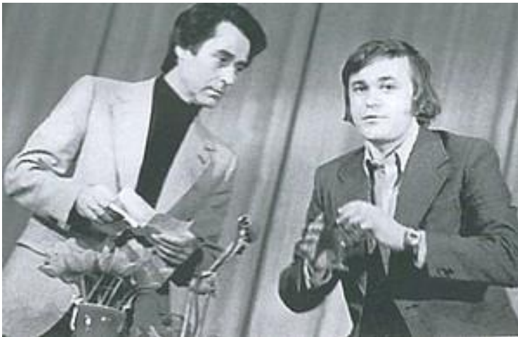
В редакции тверской газеты