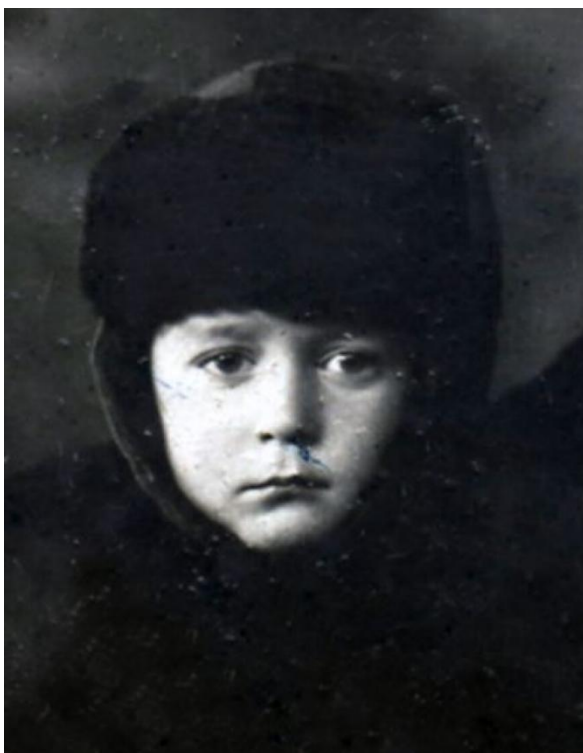
Андрей Дементьев в детстве.