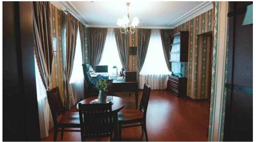
Экспозиция рабочего кабинета Андрея Дементьева в доме поэзии.