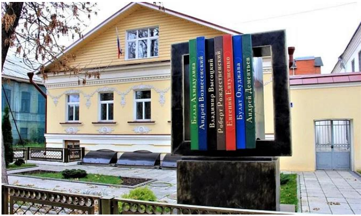
Дом поэзии Андрея Дементьева