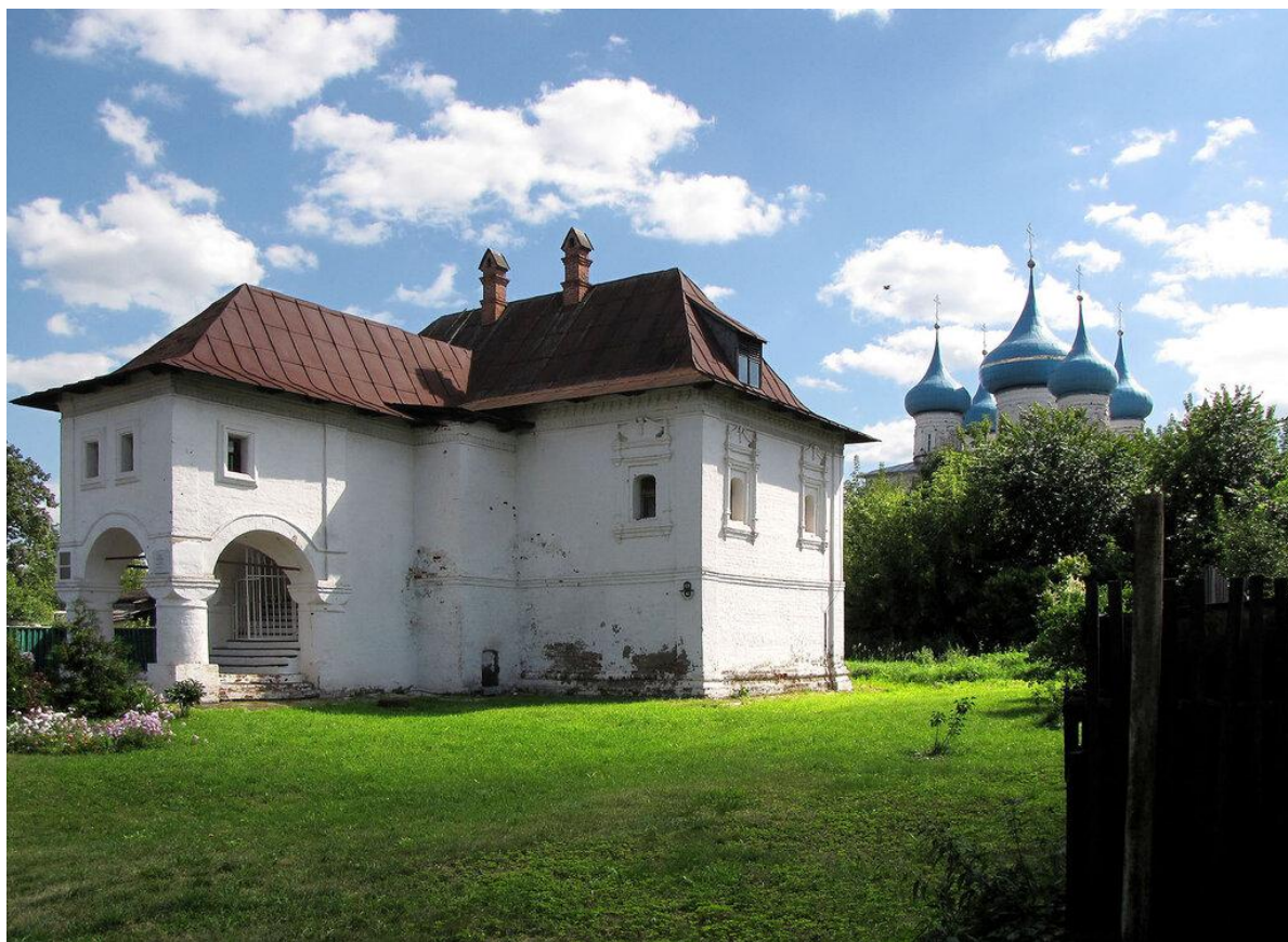
Фотография 2-Дом Опариных