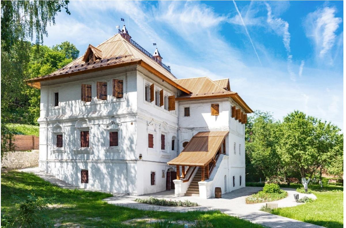
Фотография 1-Дом Ершовых