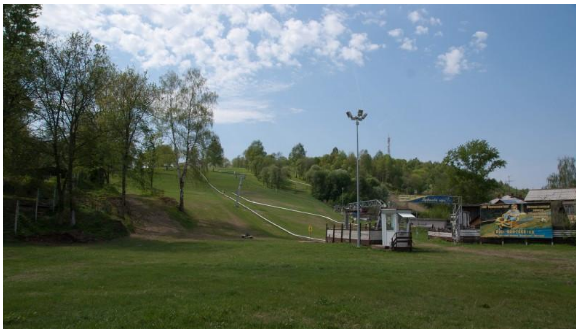
Фотография 3- Пужалова гора