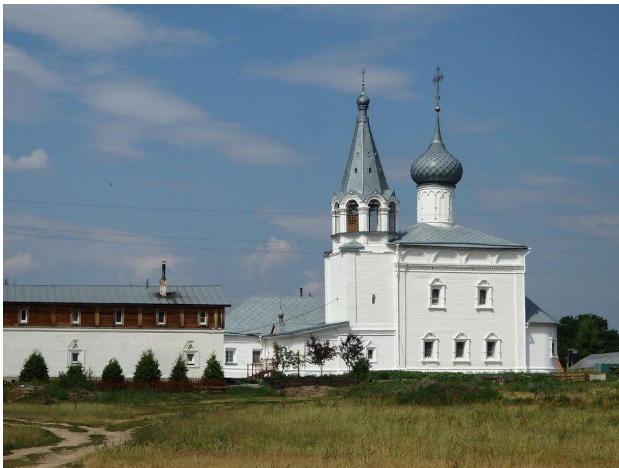
Фотография 5-Знаменский монастырь