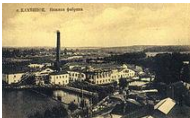
Каменская бумажно-картонная фабрика