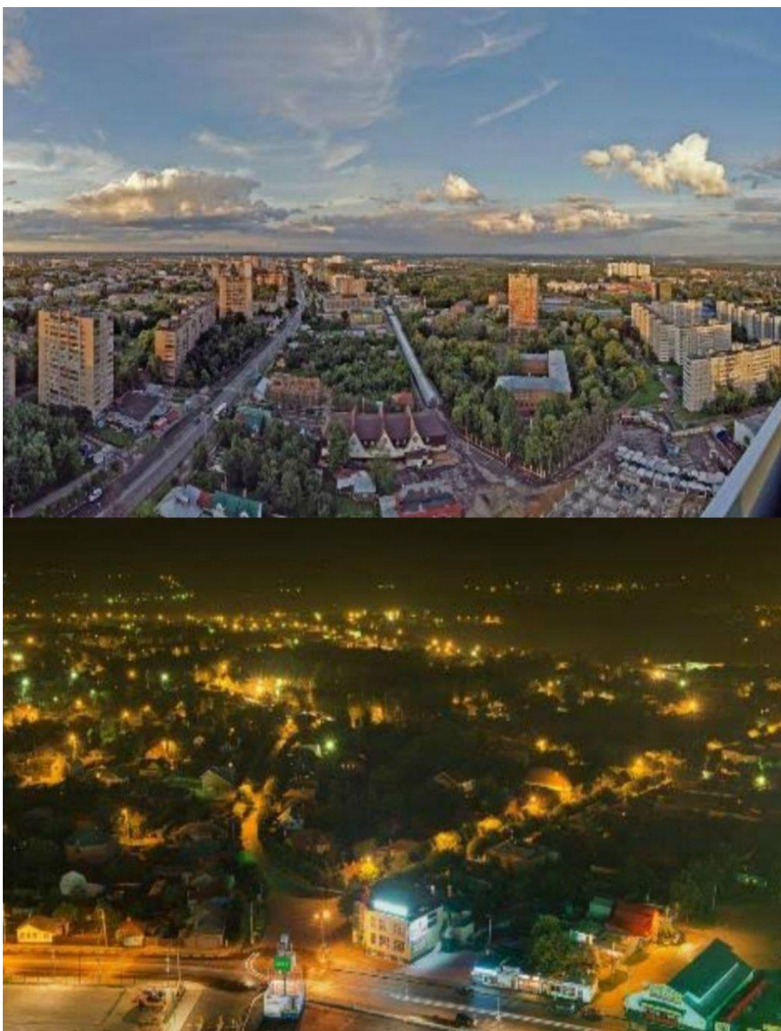
Вид из панорамных окон ресторана «Высокая Кухня»