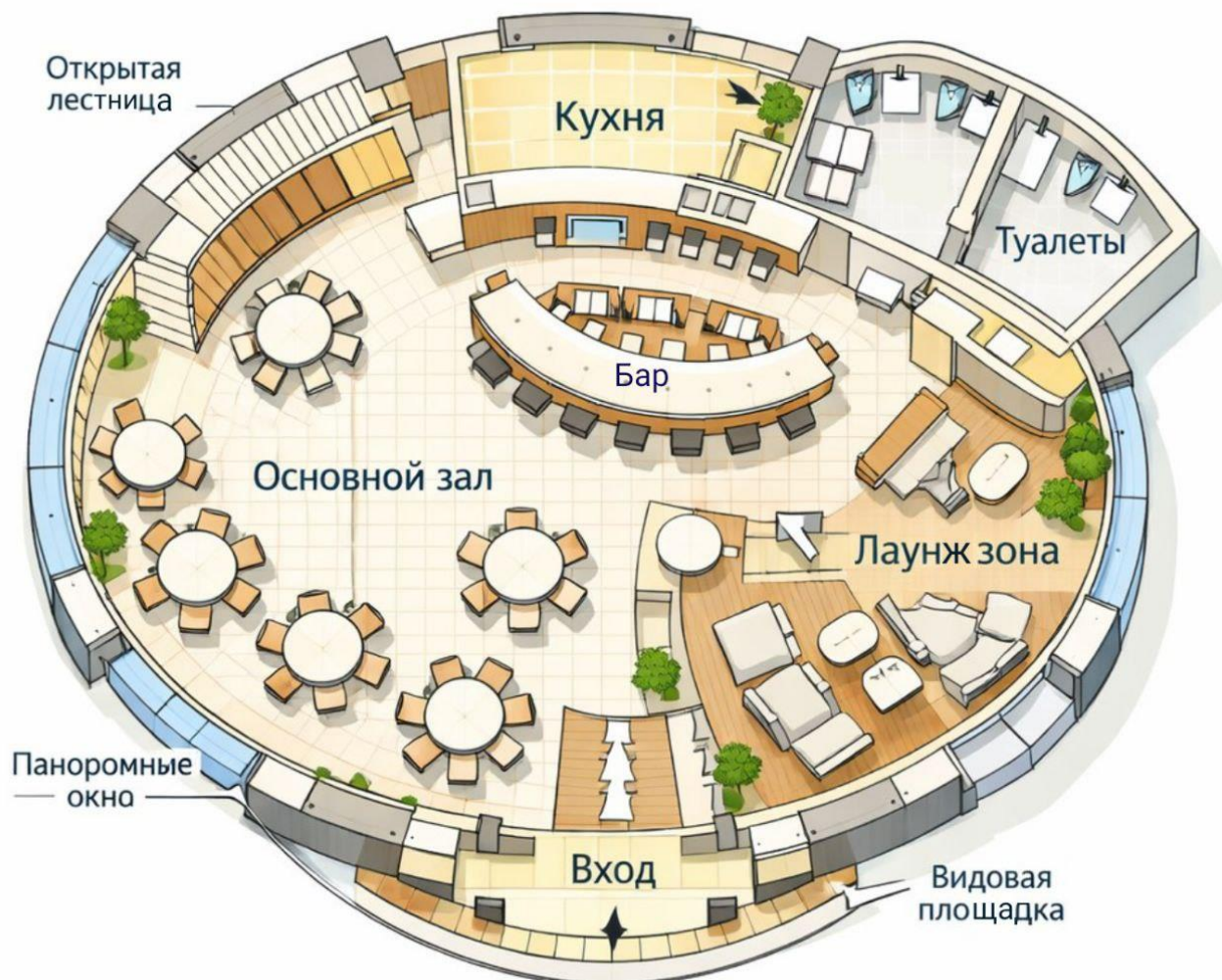
Планировка ресторана «Высокая Кухня»

Ресторан в Водонапорной башне г. Серпухов