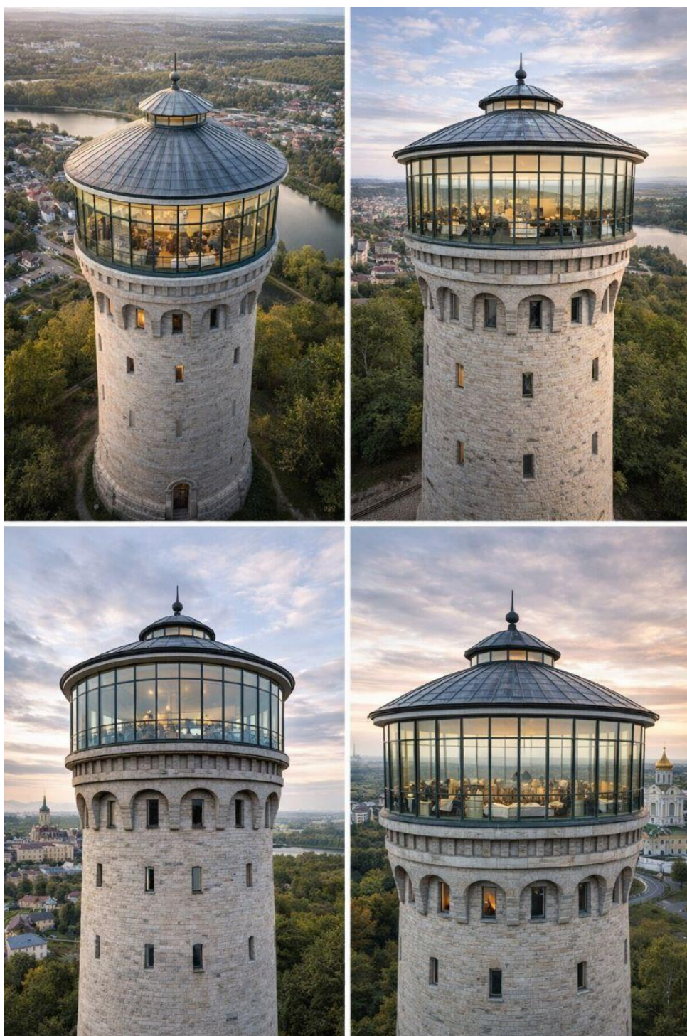
Водонапорная башня после реконструкции в ресторан «Высокая Кухня»