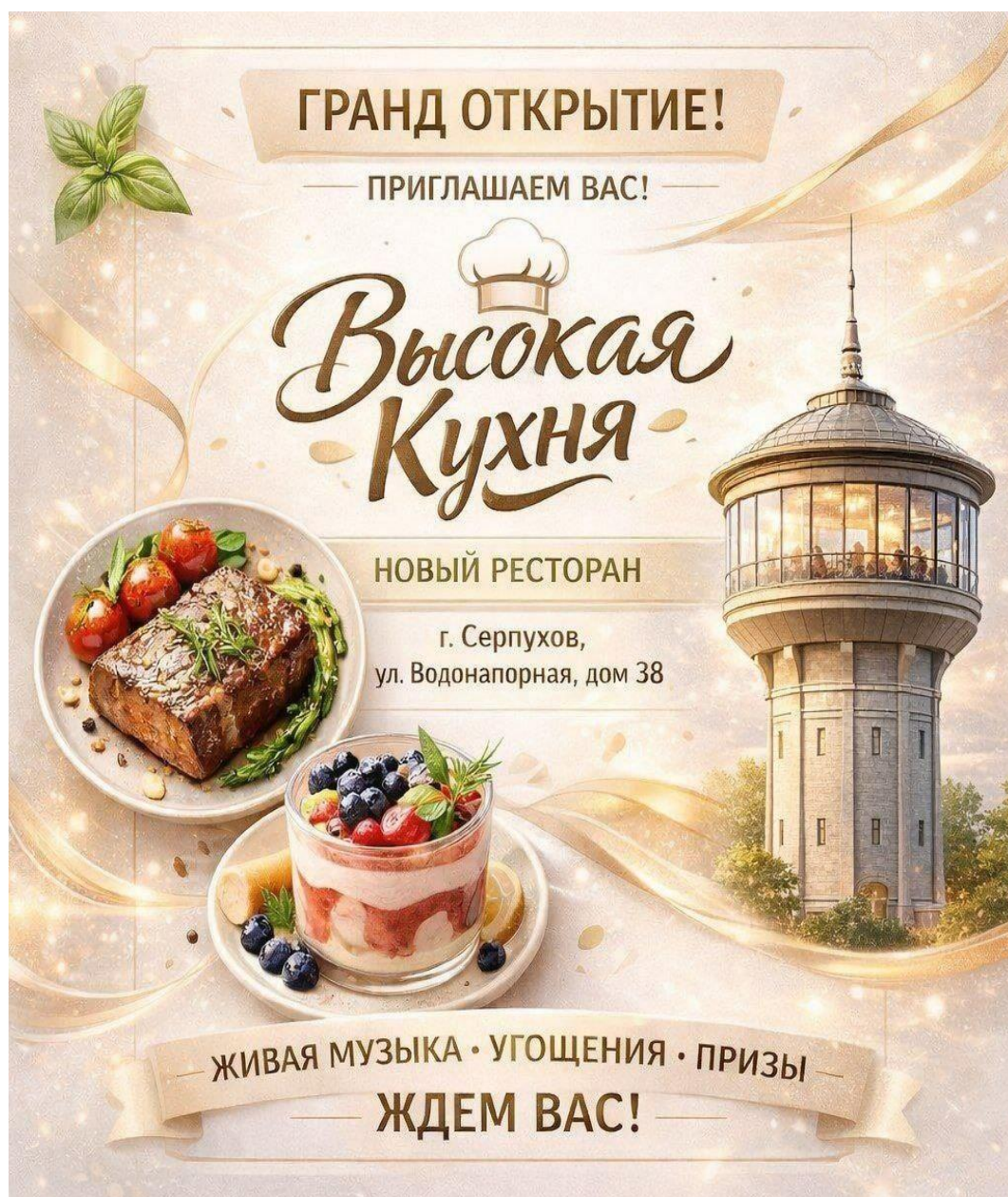
Реклама-приглашение на открытие ресторана «Высокая Кухня»