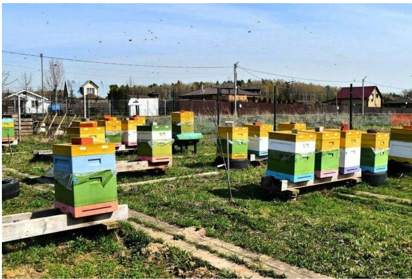
Пасека «Медовый сад»

Адрес: Московская область, городской округ Серпухов, деревня Клеймёново-1, КП Клеймёново-1, 7Б, 1-й этаж.