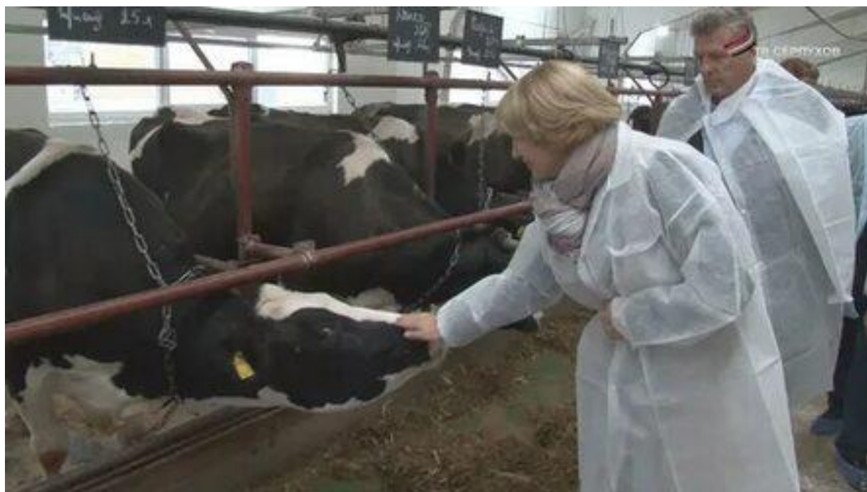
Проверка работы фермы «Дашковка»

Адрес: Московская область, Серпуховский район, посёлок Большевик, ул. Ленина, д. 44