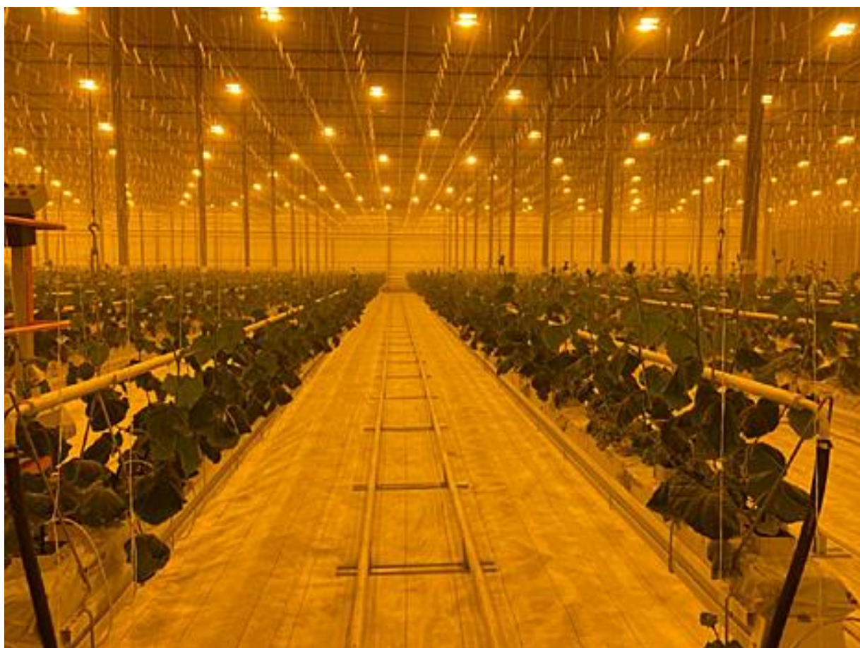
Туровский тепличный комплекс

Адрес: Московская область, г. о. Серпухов, тер. Турово-1, д. 1, стр. 1, офис 16