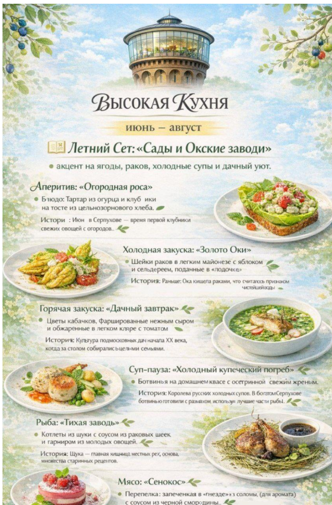
Сезонное меню «Лето»