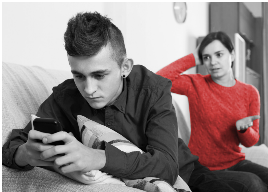
СХЕМА РАЗГОВОРА НА ЭТУ ТЕМУ